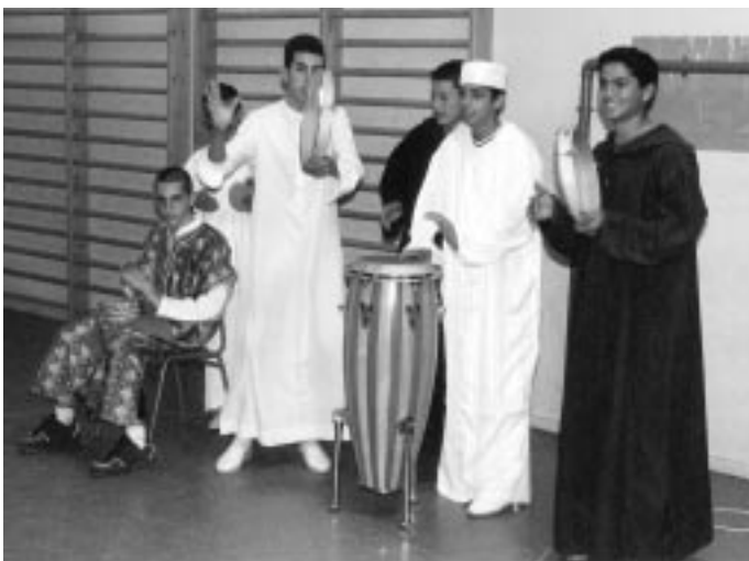
Las Jornadas Interculturales pretenden fomentar la tolerancia y la integración de las diferentes culturas que están presentes en el centro educativo.

La experiencia se ha constituido alrededor de un proyecto de innovación educativa en el que se ha trabajado desde principio de curso por parte de veintitrés docentes. Para abordar esta labor los profesores se formaron en las diferentes culturas de inmigración, realizaron contactos con asociaciones de inmigrantes y con otras que trabajan con ellos en Getafe, investigaron los estereotipos