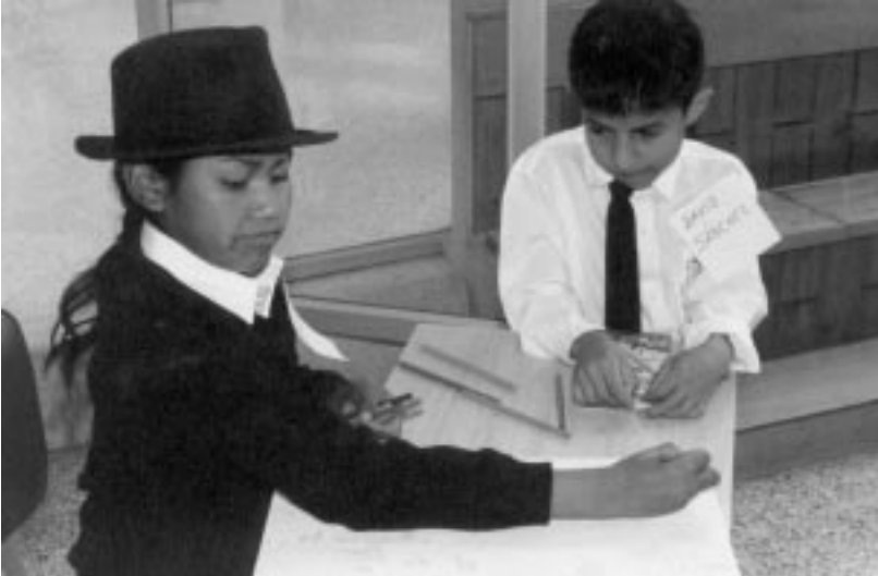
Estos encuentros permiten la participación de la niñez, de los educadores y los padres y madres de familia en el desarrollo de hábitos de lectura, expresión escrita, oral y manifestaciones artísticas

Aide et Action (Francia), ActionAid (Gran Bretaña), ActionAid (Irlanda), ActionAid (Grecia). Todas estas organizaciones trabajamos juntas en proyectos de desarrollo, actividades de sensibilización y programas concretos.