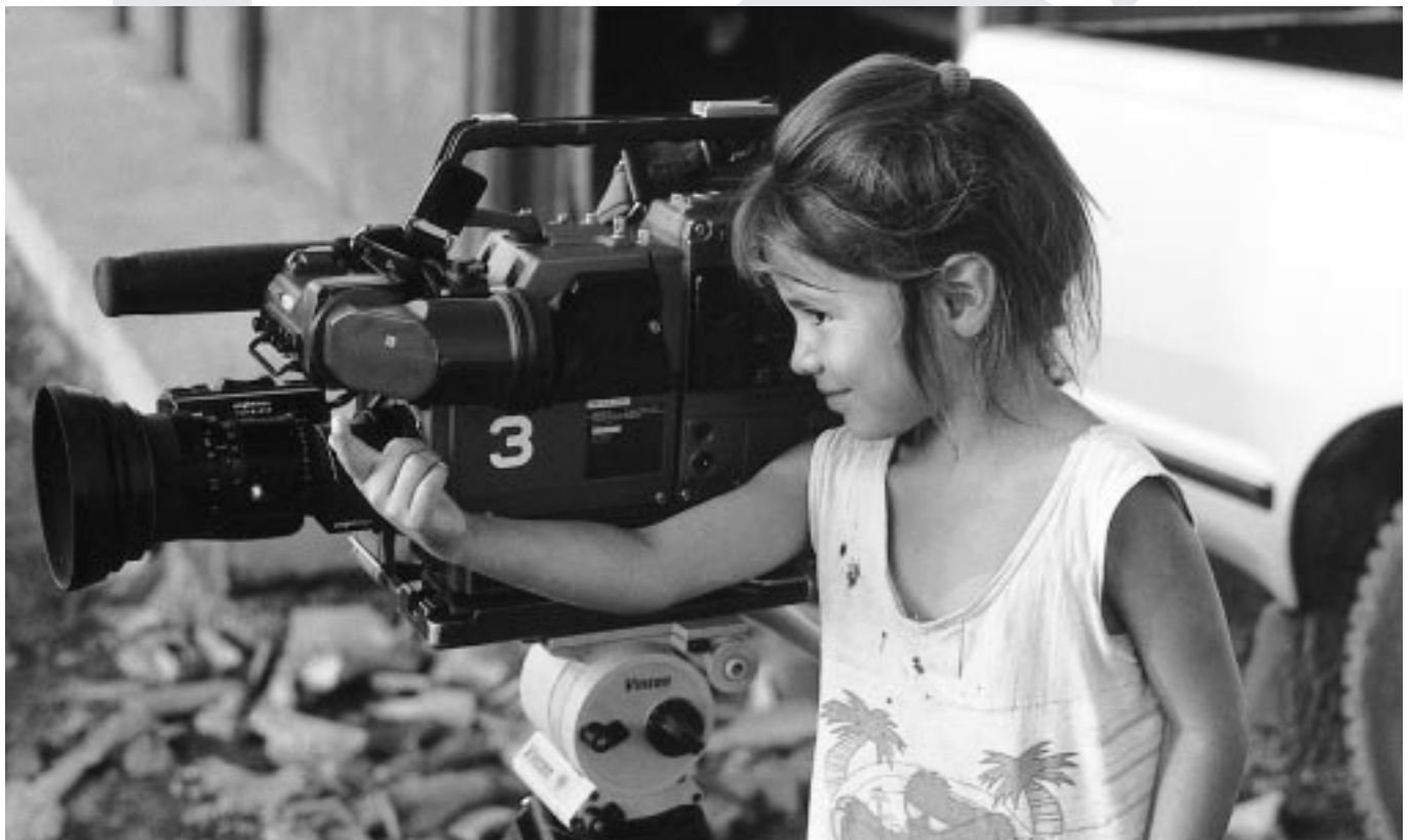
La libre circulación de información se convierte para el Sur en una metáfora de lo imposible.

Fuente: Boletín Solidarios para el Desarrollo. Noviembre-Diciembre 2000