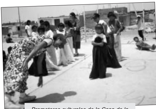
Promotores culturales de la Casa de la Juventud de Villa El Salvador. Perú.