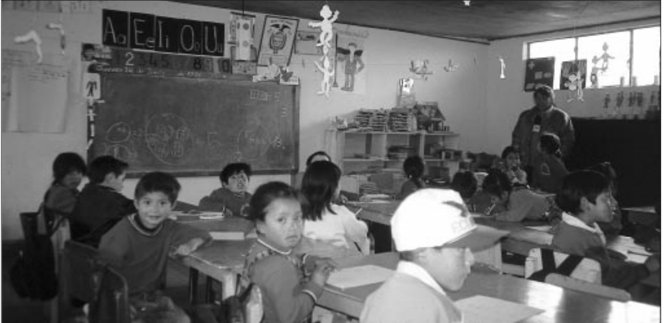
Los centros infantiles potencian el desarrollo integral de los ni3os