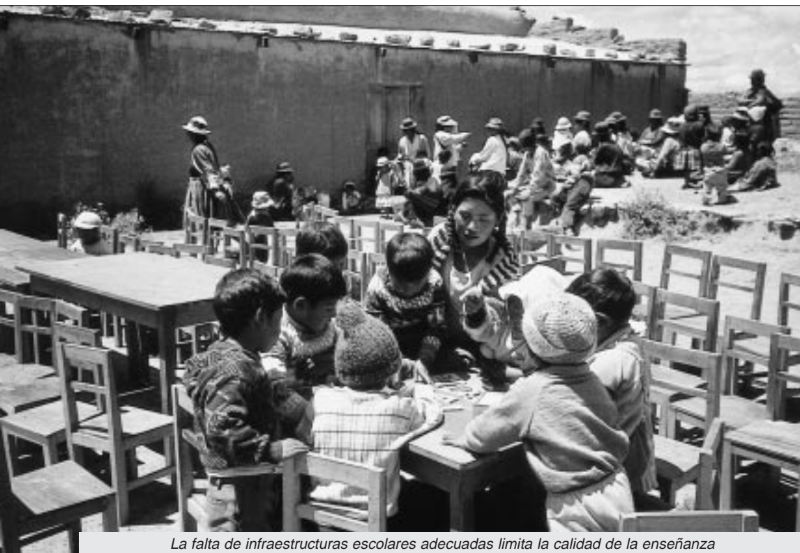
La falta de infraestructuras escolares adecuadas limita la calidad de la enseñanza

P aralelamente a la obtención de fondos con los que completar la financiación del proyecto de Cusubamba, la recaudación de las actividades organizadas por los Grupos de Voluntariado de Ayuda en Acción está siendo destinada a Bolivia, donde reconstruiremos dos escuelas de las que se beneficiarán más de 430 personas.