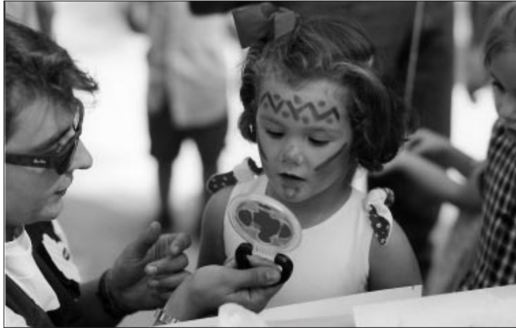
Sensibilizar a través del juego es uno de los objetivos de nuestras actividades de calle

SAN SEBASTIÁN: Memoria de actividades. Presentación a empresas del proyecto de construcción de un